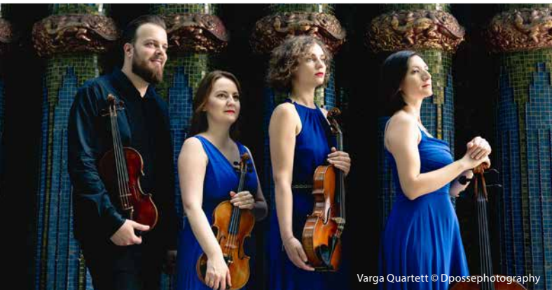
Varga Quartett