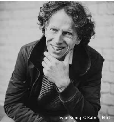
Iwan König © Babett Ehrh