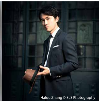
Haiou Zhang © SLS Photography