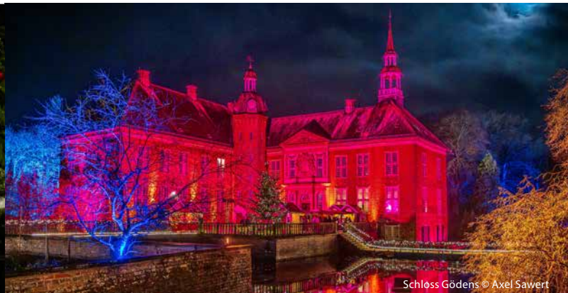
Schloss Gödens