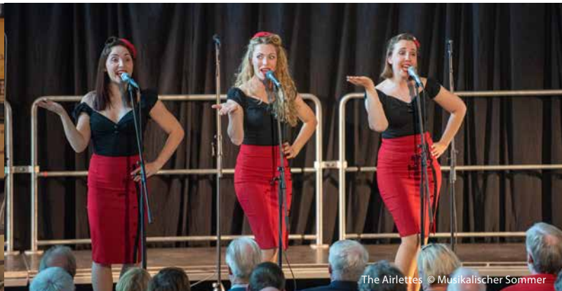
The Airlettes

Mit ihrem perfektionierten Close-Harmony-Gesang entführen The Airlettes ihr Publikum auf eine musikalische Reise voll Swing , Jazz und Rockabilly . Ihr Versprechen: Vertraute Klänge, aber völlig neu interpretiert! Lassen Sie den Alltag hinter sich – The Airlettes nehmen Sie mit auf eine mitreißende Tour über die Wolken, bei der Entertainment garantiert ist!