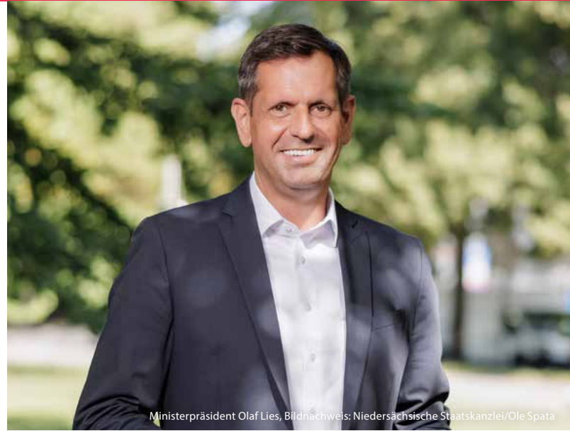
Ministerpräsident Olaf Lies, Bildnachweis: Niedersächsische Staatskanzlei/Ole Spata

Der Musikalische Sommer in Ostfriesland steht nicht nur für exzellente Konzerte, sondern auch für gelebte Gemeinschaft und kulturellen Austausch. Gerade die Musik verbindet und stärkt das Miteinander. Es ist mir daher eine besondere Freude, die Schirmherrschaft über den Musikalischen Sommer zu übernehmen und damit die Wertschätzung der Landesregierung für dieses außergewöhnliche Festival zum Ausdruck zu bringen.