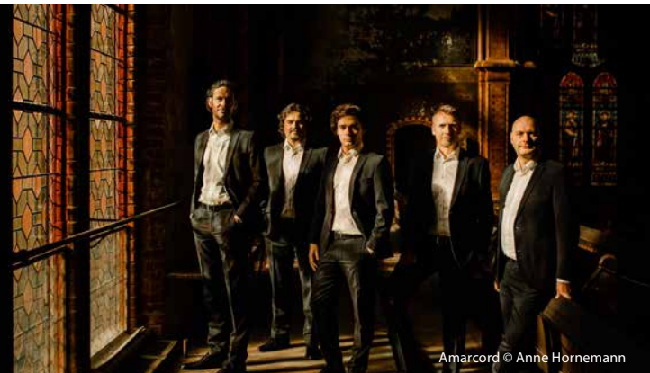
Amarcord