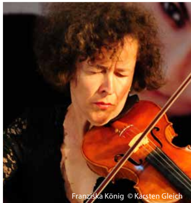
Franziska König