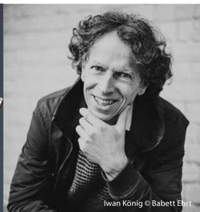
Iwan König