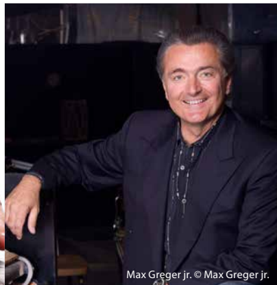
Max Greger jr. © Max Greger jr.