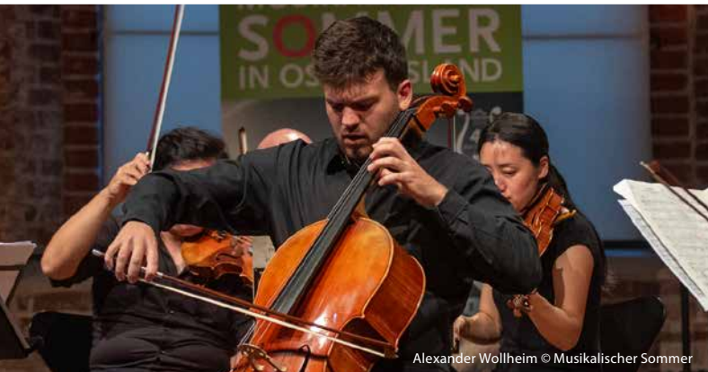
Alexander Wollheim