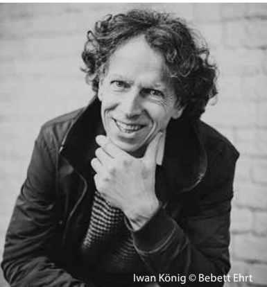
Iwan König