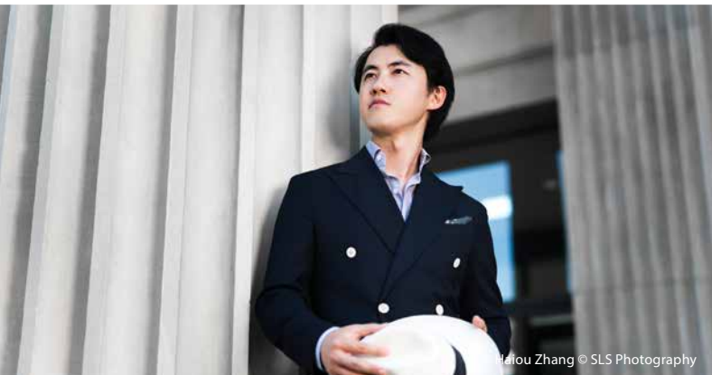
Haiou Zhang