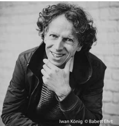
Iwan König