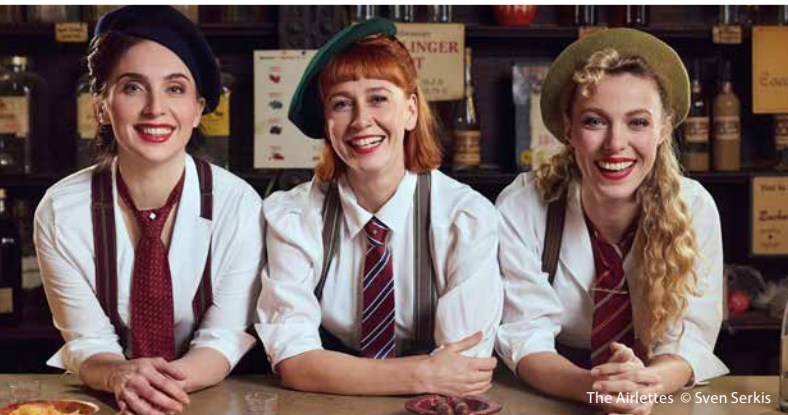
The Airlettes