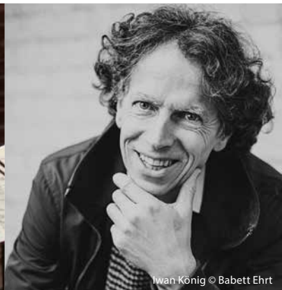
Iwan König